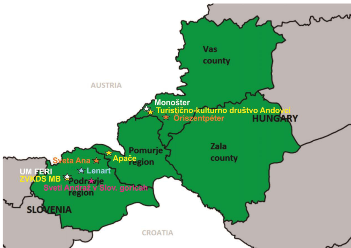
Slika 1: Zemljevid partnerjev